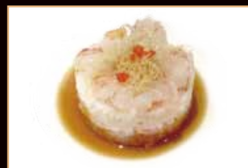
28. Amaebi tartar

tempura di alghe, tarta di salmone spicy, sesamo, avocado con salsa teriyaki € 7.00