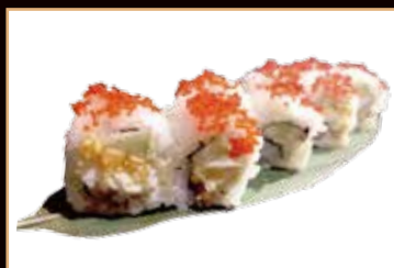
59. Egg roll uovo sodo mayo cetrioli esterno tobiko € 7.00