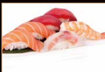
108. Nighiri mix (6pz)