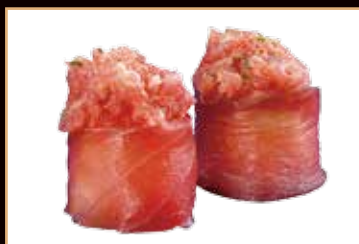
94. Gunkan gio tuna

tonno esterno, tartare tonno, tabasco, olio di oliva ex