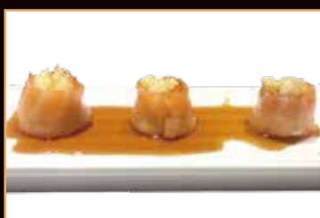
17. Sake imo yaki salmone arrotolato con purè di patate e salsa teriyaki (3pz) € 4.00