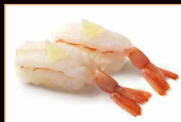
112. Amaebi crudo (2pz)

branzino scottato salsa teriyaki kataifi mandorle or pistachio € 2.50