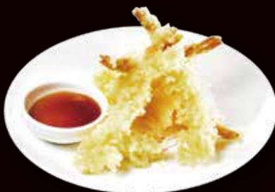
170. Ebi tempura* tempura di gamberoni € 8.00