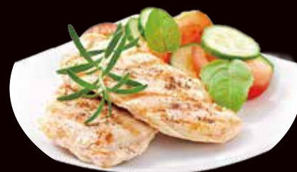
178. Tori tataki pollo alla griglia € 6.00