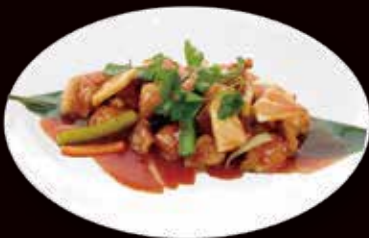
149. Pollo in salsa agro-dolce € 5.50