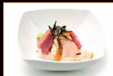
99. Cirashi mix