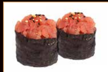
89. Gunkan tonno