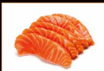
114. Sashimi salmone