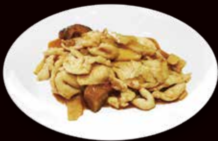
152. Maiale bambu e funghi saltati