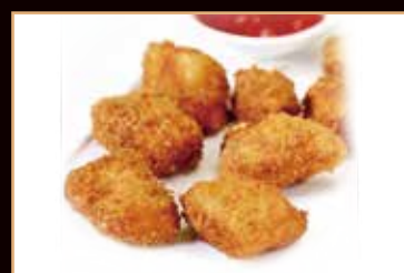
18. Tori karaage pollo fritto giapponese € 4.00