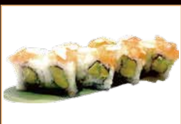
61. Rock roll avocado, Philadelphia, esterno tarta di salmone, mandorle croccante € 8.50