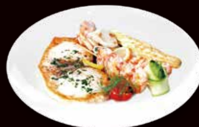
181. Teppanyaki maix pesce misto € 6.00