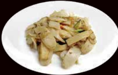
144. Gnocchi di riso saltati con verdure miste € 4.00