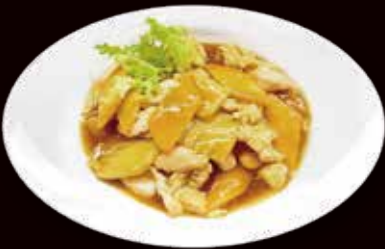
146. Pollo con mandorle € 5.50