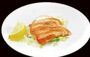
177. Sake teriyaki salmone griglia con salsa teriyaki € 6.00