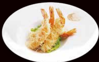
173. Ebi tempura con kataifi (4 pz) € 6.00