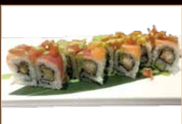
64. Rainbow special* gamberone in tempura, philadelphia, esterno pesce misto, pomodoro, salsa rucola € 8.50