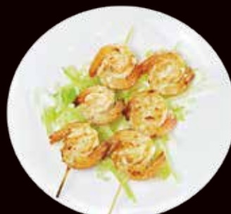
180. Ebi kushi yaki spiedini di gamberi € 6.00