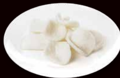
175. Nuvolette di drago € 6.00