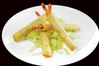
167. Ebi stick* stick di gamberi con edamame € 6.00