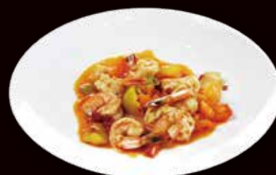
164. Gamberi al curry* € 6.00