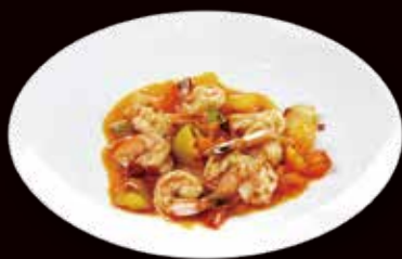
162. Gamberi in salsa agro-dolce* € 6.00