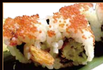
62. Uramaki tobiko gamberone in tempura, avocado, mayo, esterno tobiko, salsa teriyaki € 8.00