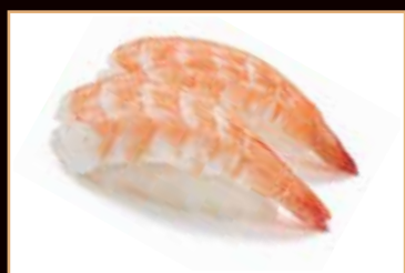
107. Gamberi cotti*