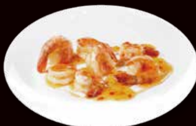
163. Gamberi in salsa chili* € 6.00