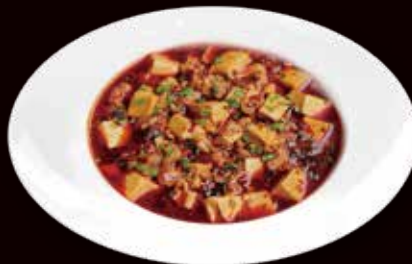
161. Tofu in salsa chili