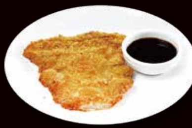
168. Tonkatsu cotoletta di maiale € 6.00