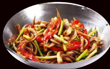
184. Scodella di fuoco con calamari* € 7.00