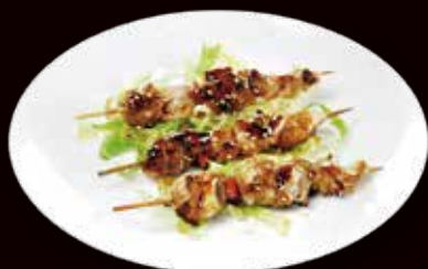
179. Yaki tori spiedini di pollo con salsa teriyaki € 6.00