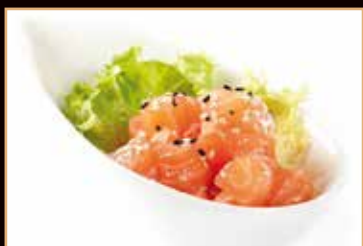
23. Sake tartar