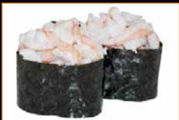
87. Gunkan ebi*