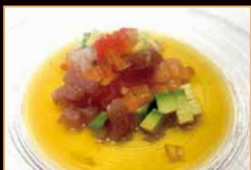
26. Suri tartar

Tartare di salmone, tonno, branzino € 7.00