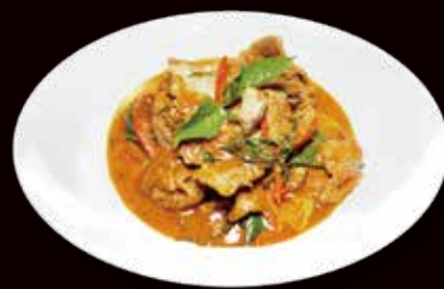
156. Manzo saltato al curry