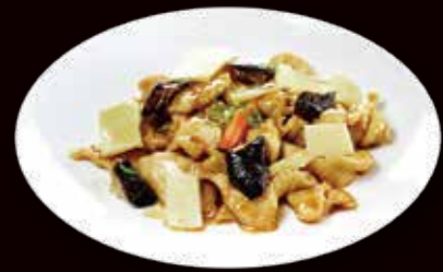
148. Pollo con bambu e funghi € 5.50