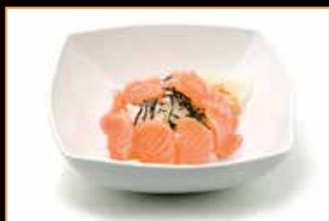
97. Cirashi salmone

fettine di pesce crudo su letto di riso del sushi