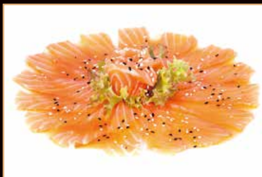
100. Carpaccio salmone

sottili fette di pesce (max 2 porzione / persona) 12 fette