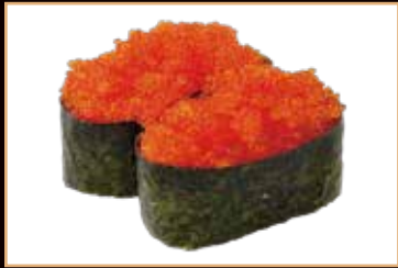
92. Gunkan tobiko