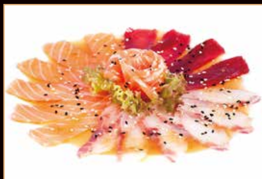
103. Carpaccio misto