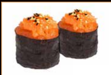
88. Gunkan salmone