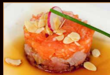
25. Tartar mix

Tartare di salmone, tonno, branzino € 7.00