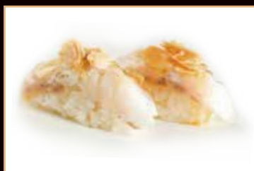
111. Branzino cotto

salmone scottato salsa teriyaki kataifi mandorle or pistachio € 2.50