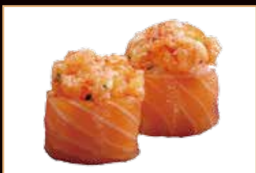
93. Gunkan gio salmon

sushi bigne con pesce all'esterno 2pz, max 2 porzione/persona