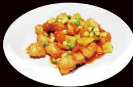
153. Maiale in salsa agro-dolce