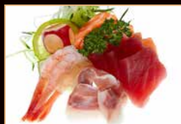
115. Sashimi mix