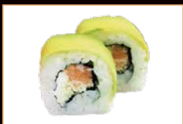
63. Fever roll salmone, philadelphia, esterno avocado, kataifi, salsa teriyaki € 8.00