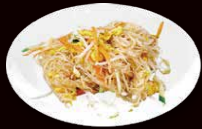
142. Spaghetti di riso saltato con uovo e verdure € 3.50