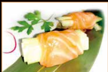
13. Spring fresh salmon salmone crudo, cetrioli consalsa (4pz) (max 2 porzione/persona) € 5.00