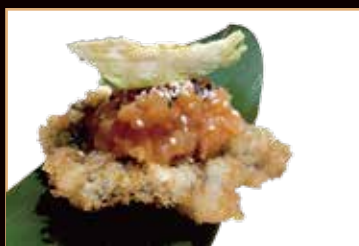
27. Nori salmone

Tartare mista pomodorino, avocado € 8.00