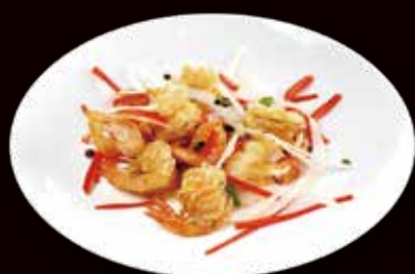
165. Gamberi con sale e pepe* € 6.00