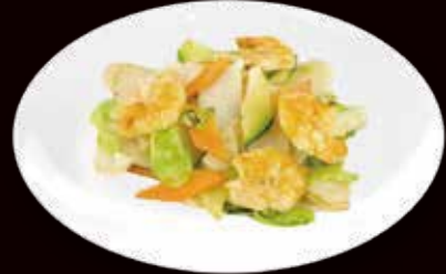
145. Gnocchi di riso saltati con gamberi* € 4.50