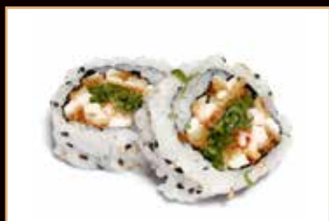
58. Chicken roll pollo fritto, mayo, insalata, esterno kataifi, salsa teriyaki € 7.00