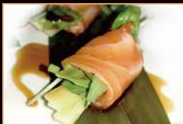
14. Spring fresh cetriolo e rucola salmone crudo cetrioli rucola (4pz) (max 2 porzione/persona) € 5.00