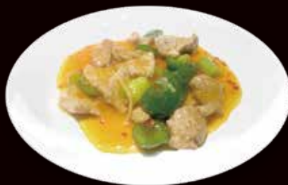
155. Manzo saltato con salsa piccante