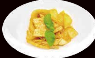
150. Pollo in salsa curry con patate € 4.00