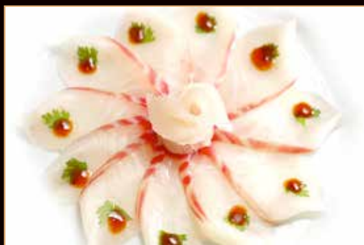
102. Carpaccio branzino