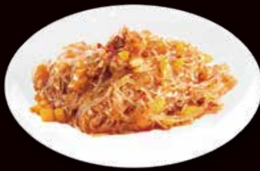
141. Spaghetti di soia saltato con maiale piccante € 5.00