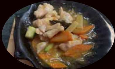
151. Pollo alla piastra € 6.00