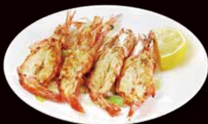
182. Gamberoni alla griglia* max 2 porzione / persona € 6.00