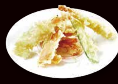
172. Tempura mista* gamberoni e verdure € 6.00