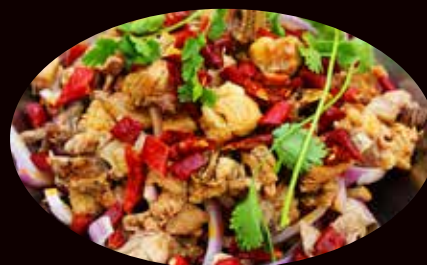
186. Scodella di fuoco di pollo € 7.00