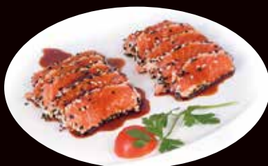
176. Tataki salmone salmone scottato con sesamo € 6.00