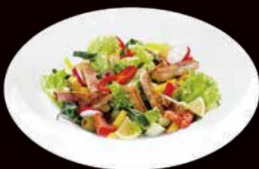
19. Insalata di pollo € 5.00