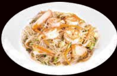
143. Spaghetti di riso saltato con gamberi* € 4.00