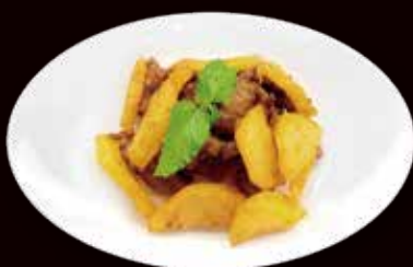
157. Vitello in salsa curry con patate