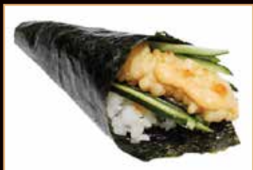
32. Temaki ebiten*

surimi di granchio, cetrioli, avocado, mayo € 3.50