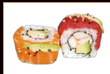
57. Uramaki rainbow salmone Philadelphia esterno pesce misto € 8.00