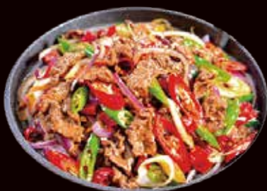
154. Manzo con verdure alla piastra