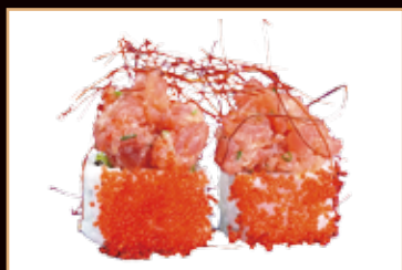
55. Uramaki spicy tuna tonno, tabasco, mayo, cetrioli, tobiko € 8.00

rotolo medio con riso e sesamo all'esterno 8pz