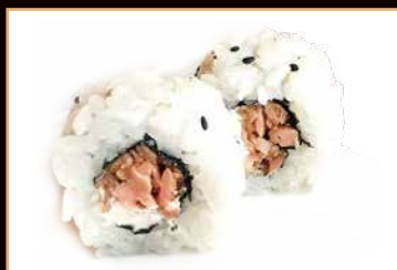
56. Uramaki miura salmone cotto, philadelphia, insalata, salsa teriyaki € 6.00