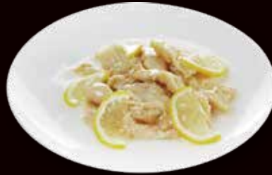
147. Pollo con salsa limone € 5.50