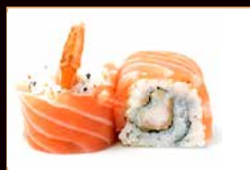
65. Tiger roll* gamberone in tempura, mayo esterno pesce misto salsa teriyaki € 8.50