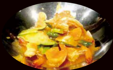
183. Scodella di fuoco ai gamberi € 8.00