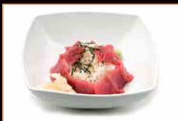
98. Cirashi tonno