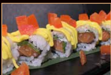
60. Malibu roll salmone, philadelphia, insalata, pomodoro, salsa zafferano € 8.00