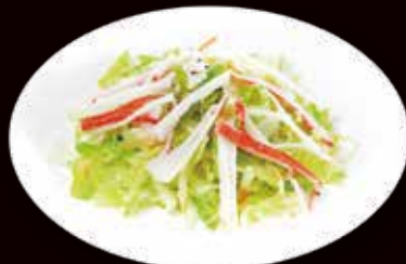
20. Insalata di granchio* € 4.00