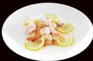
166. Gamberi in salsa limone € 6.00