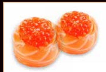
96. Gunkan ikura