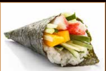
31. Temaki california*

surimi di granchio, cetrioli, avocado, mayo € 3.50