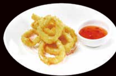
169. Ika tempura* tempura di calamari € 6.00