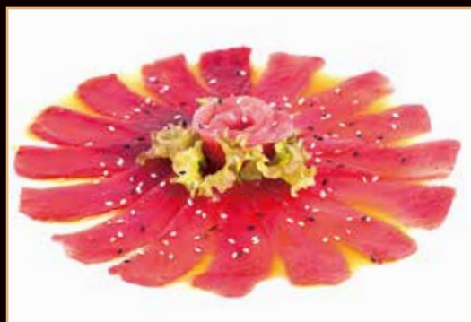
101. Carpaccio tonno