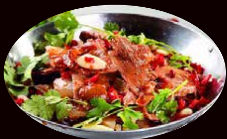
185. Scodella di fuoco di manzo € 8.00