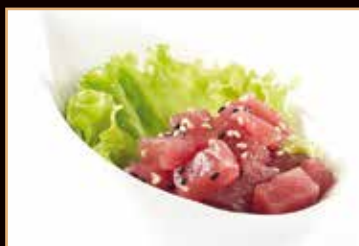
24. Maguro tartar