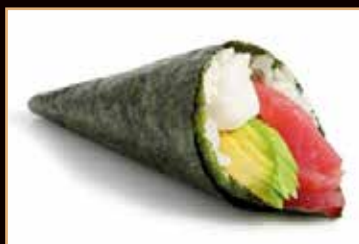
30. Temaki maguro