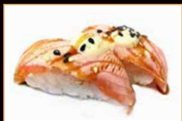
110. Nighiri Gio salmone

salmone scottato salsa teriyaki kataifi mandorle or pistachio € 2.50