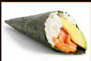
29. Temaki sake