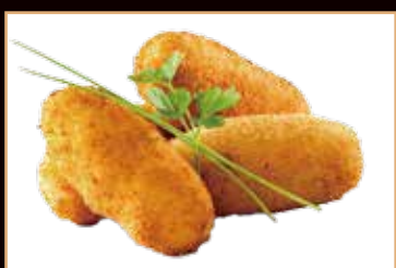
16. Korokke crocchette di patate giapponese surimi di granchio e cipolla (2pz) € 3.00