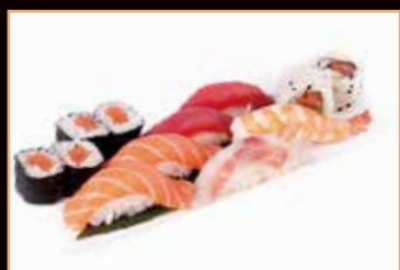
113. Sushi mix