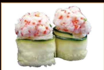
95. Gunkan zucchine

zucchina scottata esterna, gamberi cotti