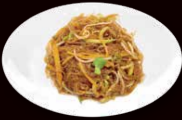
140. Spaghetti di soia saltato con verdure € 4.00