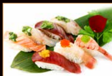
109. Nighiri special(4pz)